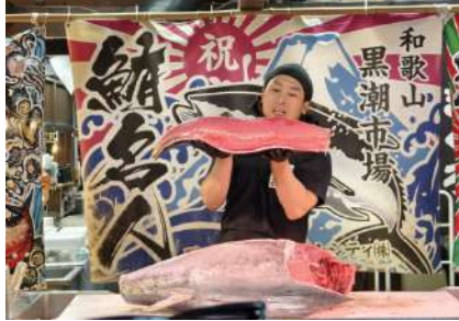
黑潮市場鮭魚解體秀