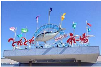
白濱海岸漁師市場