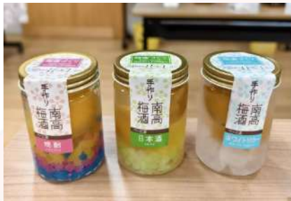
紀州梅干館手作梅酒體驗