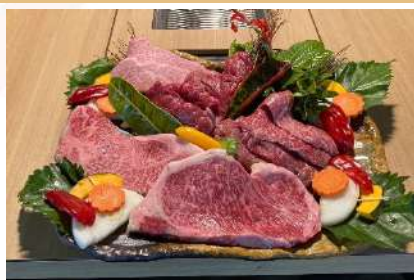
石垣牛料理 - 4 人套餐