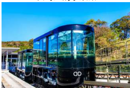
稻佐山展望台 長崎稻佐山軌道車