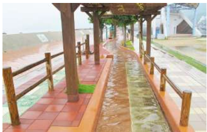
小濱足浴溫泉體驗